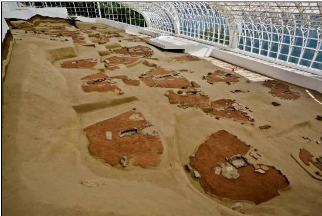
Неолитно селище Лепенски вир - музей