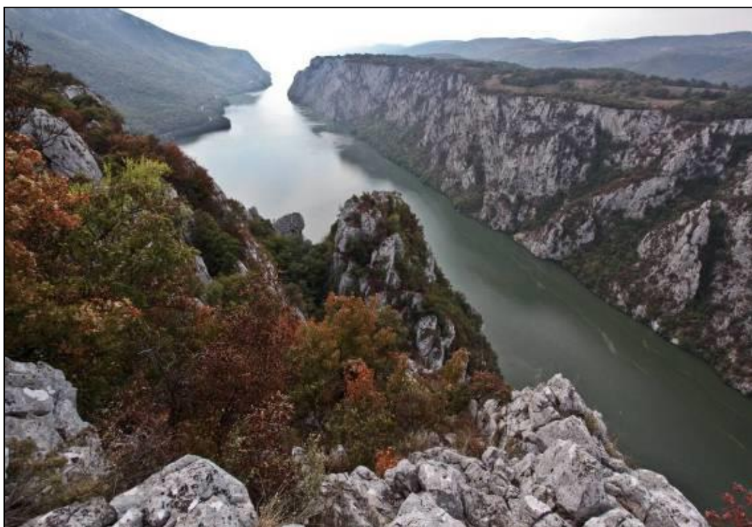
Пролома Железни врата (Джердап)