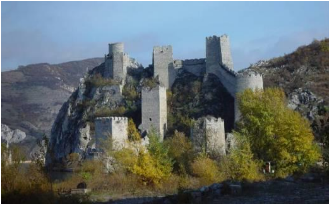
Стария град Голубац – монумент на средновековната военна архитектура