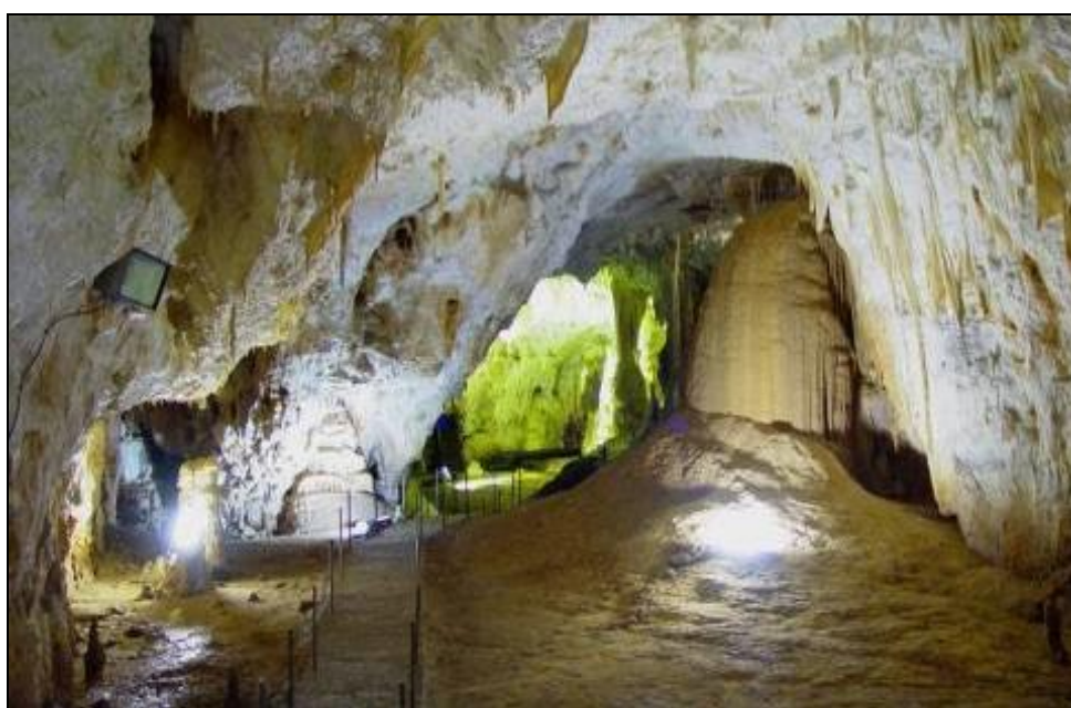
Рајкова пећера в горнојорски рифови варовици