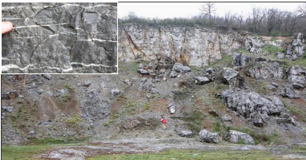
Горнојорски варовици, Бела воде