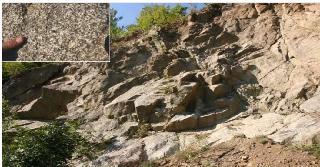
Херцински Горњански гранитоиди (I – тип)