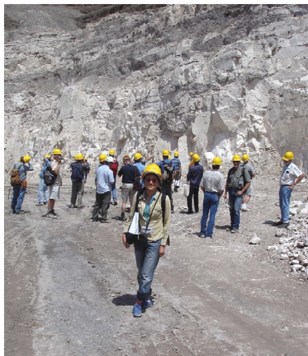
Посещение на кариерата на зеолитното находище „St. Cloud“

Проф. Мъмpton непрестанно е проявявал интерес към българските зеолитни находища, изследванията на българските учени и особено приложните тестове и използването