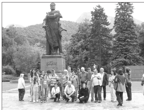
Участници в екскурзията пред паметника на Христо Ботев в центъра на гр. Враца