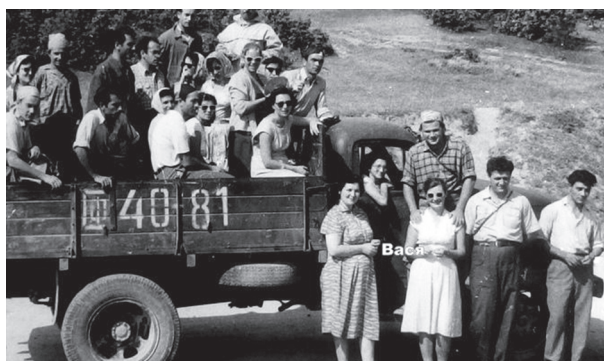
На неделна екскурзия през 1959 г. до гр. Лом с бригада № 1